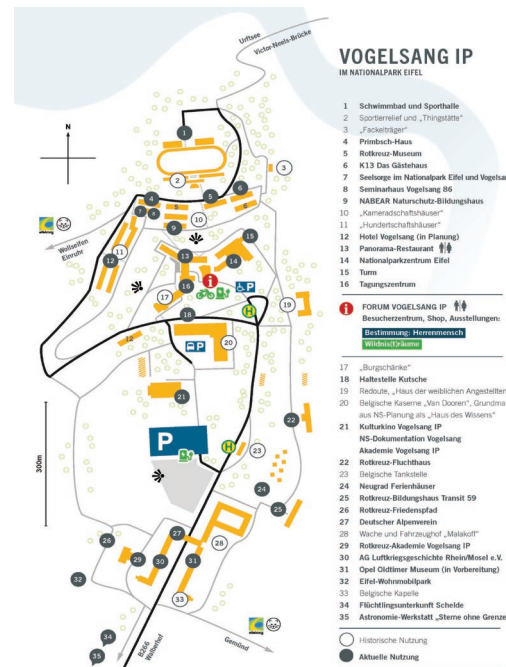
Geländeplan unter: https://vogelsang-ip.de/de/graues-menuue/besucherservice/gelaendeplan.html